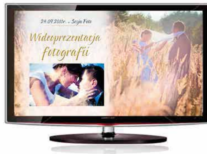
Intro prezentacji multimedialnej lub Fotografii 3D