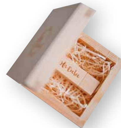
Pendrive w skrzyneczce z wideoprezentacją i fotografiami