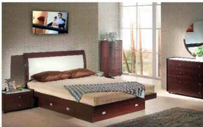
Wydruk na płótnie naciągniętym na ramki